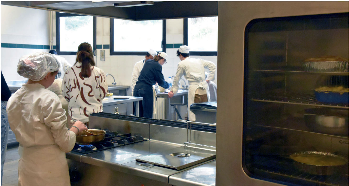
Cinq résidents des Cèdres ont cuisiné une matinée entière avec des élèves du collège Rabelais dans le restaurant d'application.