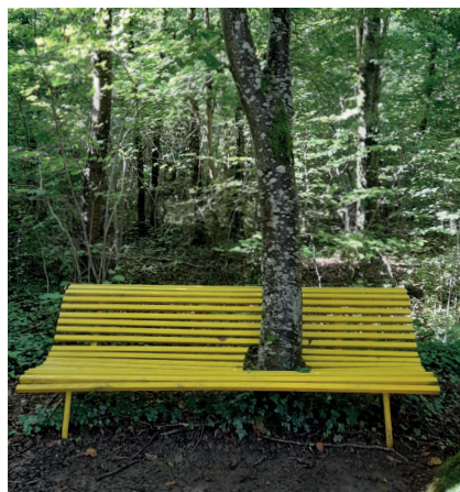
Mobilier désurbanisé, VdF 1987.

Cela passe par une évolution des pratiques qui connaît et respecte plus et mieux les cycles naturels des faunes et flores locales. Ainsi, sont expérimentées des techniques de gestion différenciée, est abandonné tout usage des produits phytosanitaires, sont priorisés les plantations de vivaces,