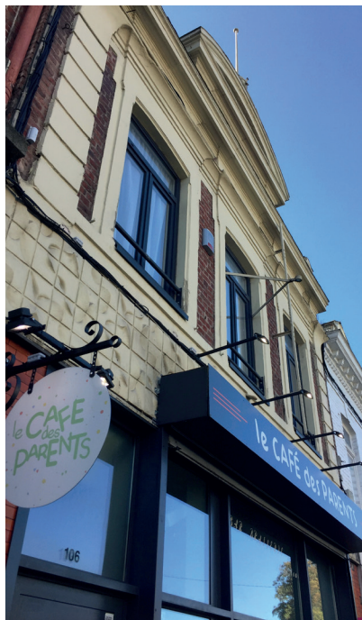
La "Café des parents" a pris ancrage dans les locaux de l'ancien "Café de la Mairie".

Si Aurore Sénat a ouvert le Café des parents , c'est pour rendre le sourire à ses clients : « Aller en famille au restaurant, souvent dépourvu de jeux, c'est forcément rendre tristes les enfants. Aller en famille dans les espaces de jeux bruyants et sans zone de repos, c'est forcément rendre tristes leurs parents... », sourit cette entrepreneure de 35 ans qui écume les aires de loisirs, un casque sur les oreilles. Une longue expérience de restauration en poche, cette maman de deux enfants faisait germer depuis longtemps un lieu rêvé, idéal pour tous les membres d'une famille.