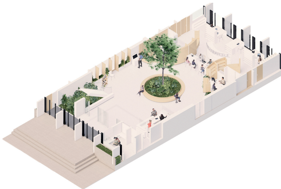
Une vue intérieure du rez-de-chaussée. (Illustration non contractuelle)

Au rez-de-chaussée, de nouveaux bureaux multiservices sont également prévus pour accueillir toutes les démarches à mener auprès des services municipaux installés dans