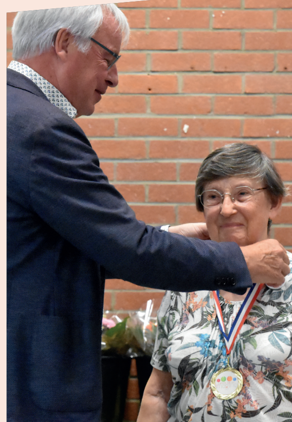
Les 60 ans du centre social Imagine ont été l'occasion de remettre des médailles à ses bénévoles engagés dans la vie associative et la Ville.

Sans vouloir précipiter les choses, avec notamment le Téléthon ou encore le marché de Noël, d'autres beaux moments collectifs s'annoncent !