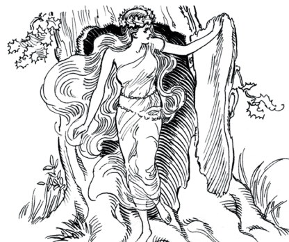
Une hamadryade sortant d'un arbre.

Et si nous avons lancé et aurons réalisé à Mons, au terme de l'année 2025, ce projet de plantation de 1000 arbres, nous avons, bien sûr, été guidés par le bénéfice de bien-être, d'équilibre urbain qu'ils nous apporteront, par souci de contre-mesures, certes infimes, à certains effets des changements climatiques. Mais peut-être avons-nous aussi répondu à l'appel de ce géant de la poésie américaine, Walt Whitman : « Redonne-moi, ô nature, tes saines primitivités ».